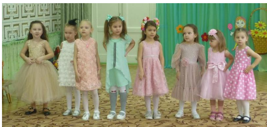
Поём песенки для наших мам