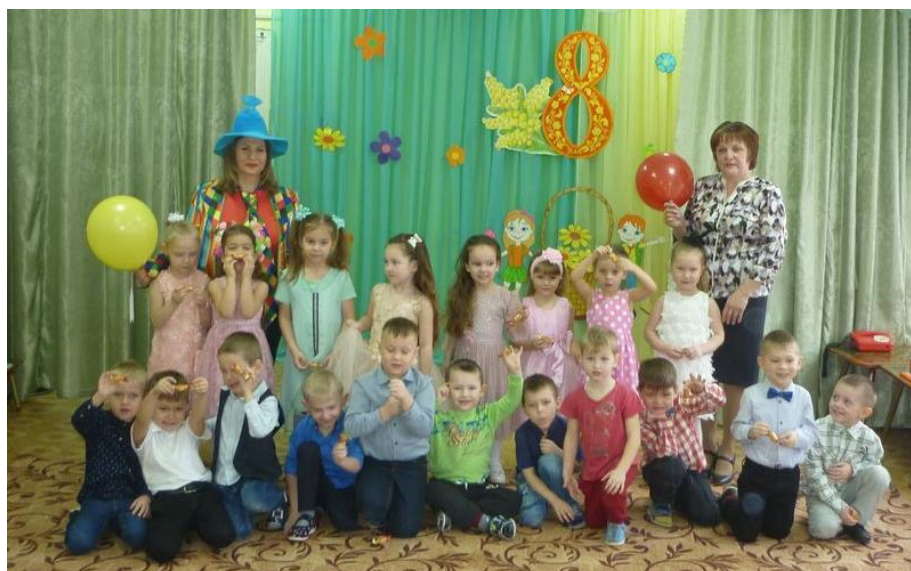
Незнайка на празднике у ребят